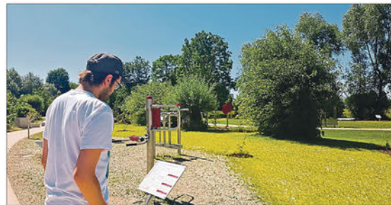
Auf Tafeln wird die Benutzung der Geräte erläutert.