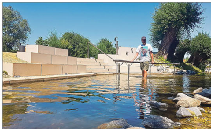
Eine Kneippanlage bringt den Kreislauf in Schwung.