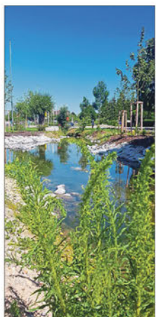
Der Stadtmühlbach wurde in diesem Bereich renaturiert.

84160 Frontenhausen - Sonnleiten 1 - Tel. 08732 / 931160 www.sportplatzbau-hilgers.de