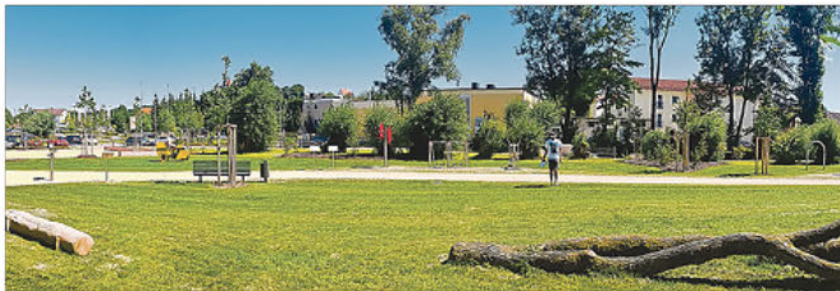
Ein weitläufiges Gelände mit viel Grün wartet auf die Besucher.